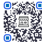
Tarifa de Estudiantes