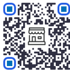
Tarifa de Miembros